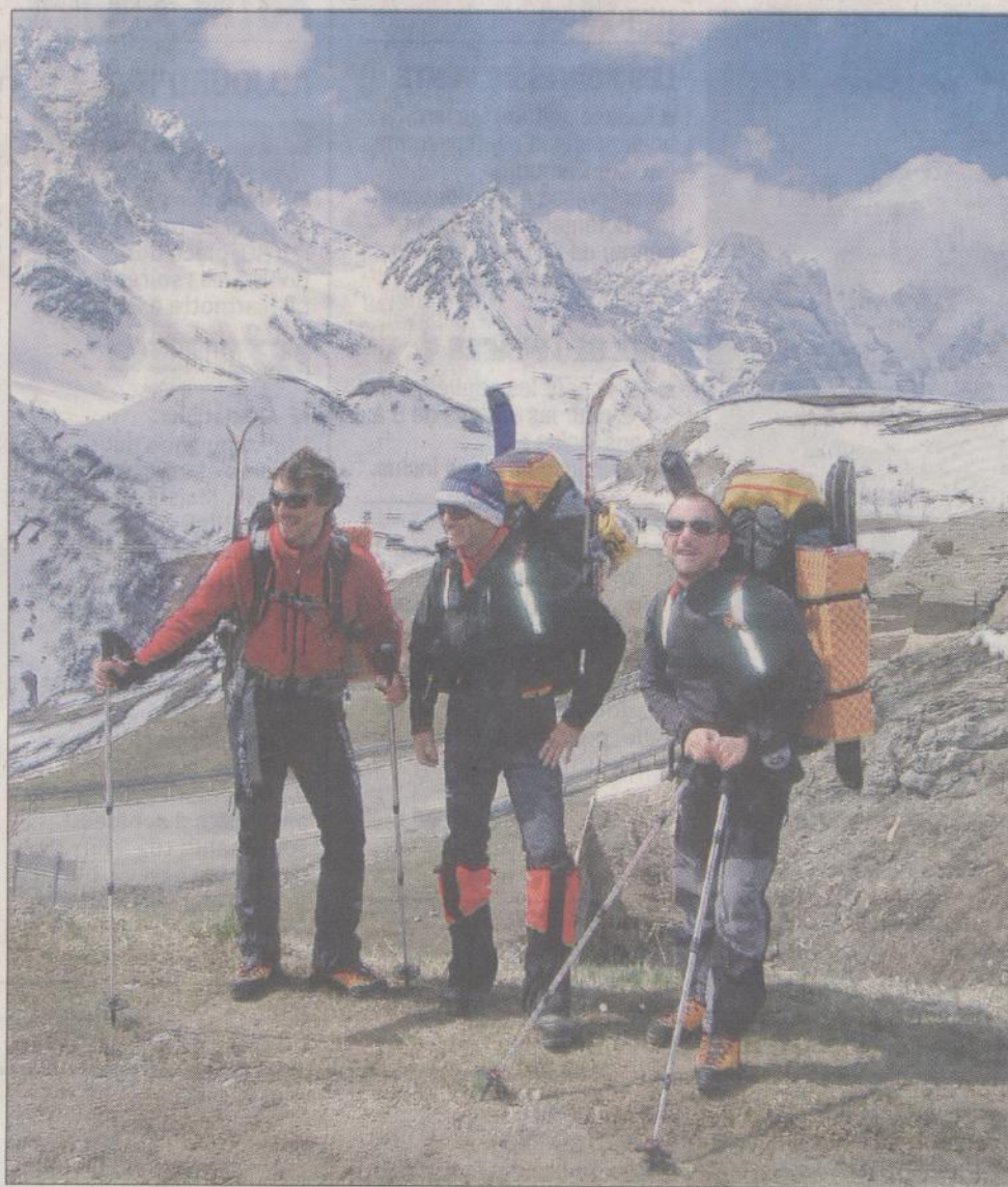
Les trois aventuriers étaient hier au col du Lautaret pour le départ d'un périple de trois mois.

Depuis quelques jours, ils se sont préparés pour ce raid. Il manque toujours du temps.